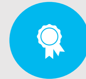
Anzahl Auszeichnungen in Fachgebieten und Branchen (alle Kategorien)